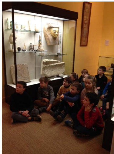
Les vitrines : statuettes de dieux et déesses, pierre de rosette...

Ensuite, direction l'atelier pour « écrire » notre prénom dans un cartouche, à la façon des égyptiens. Nous devons dessiner des symboles qui correspondaient aux lettres de notre prénom sur du papyrus.