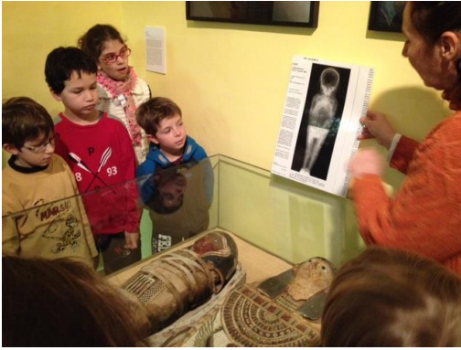
Découverte d'une momie d'enfant

Le mardi 16 , nous sommes allés au musée pour découvrir l'Égypte.