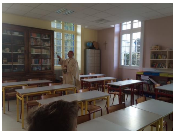
Bénédiction de notre classe