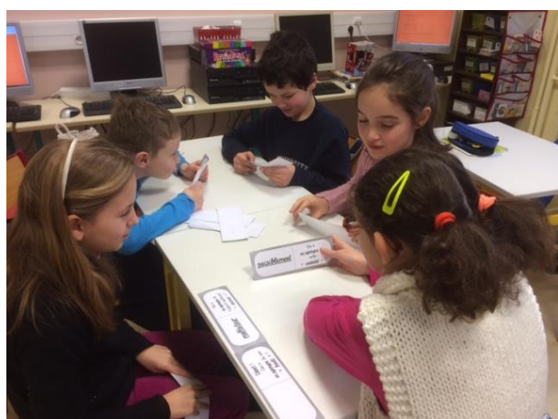
Les CE2 ont joué au domino des synonymes.