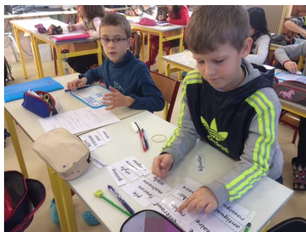
Les CM1 ont revu la notion de termes génériques avec des étiquettes.