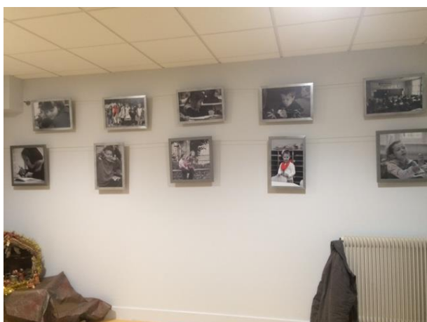
Découverte de l'exposition photos